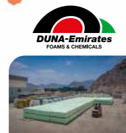
DUNA-EMIRATES LLC FZC