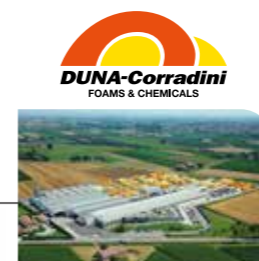
DUNA-CORRADINI SPA DUNAPACK®